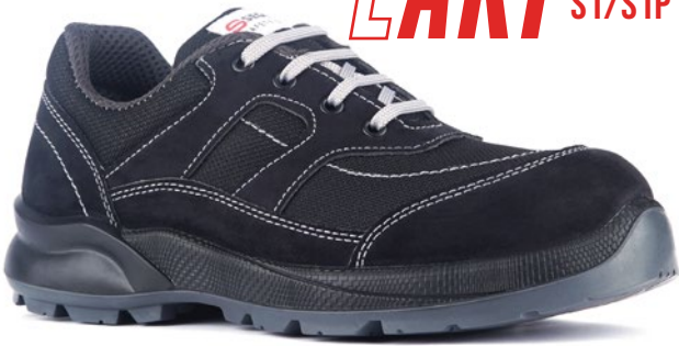
LAKI SGR-64 S1/S1P