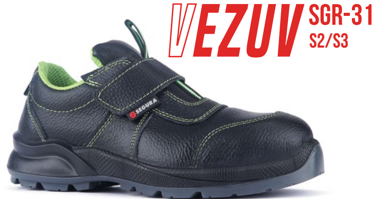
VEZUV SGR-31 S2/S3