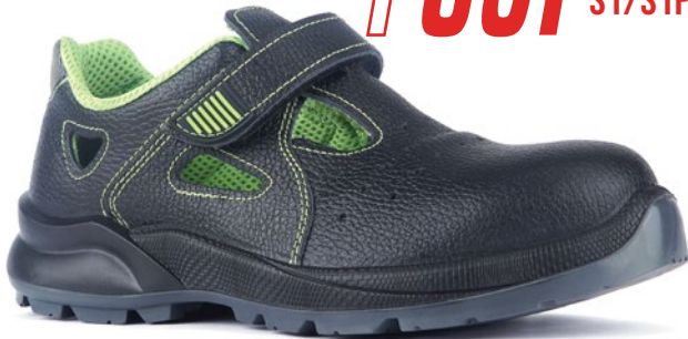
FUJI SGR-70 S1/S1P