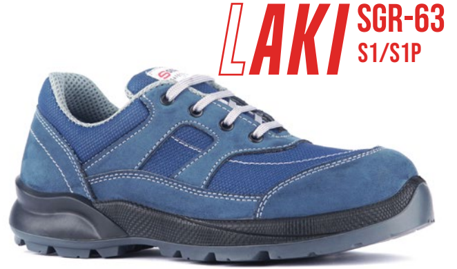
LAKI SGR-63 S1/S1P