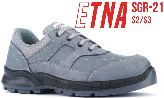
ETNA SGR-21 S2/S3