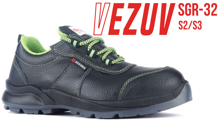
VEZUV SGR-32 S2/S3