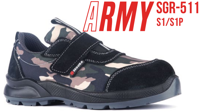
ARMY SGR-511 S1/S1P