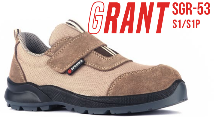
GRANT SGR-53 S1/S1P