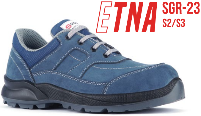
ETNA SGR-23 S2/S3