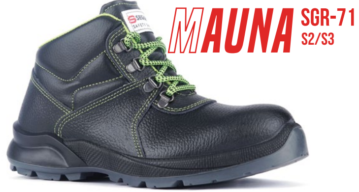
MAUNA SGR-71 S2/S3