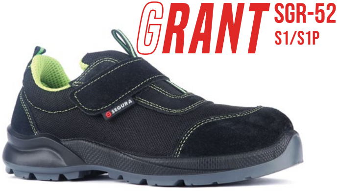
GRANT SGR-52 S1/S1P