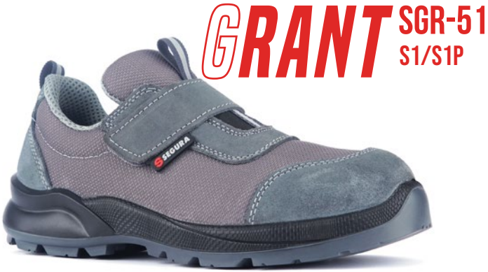
GRANT SGR-51 S1/S1P