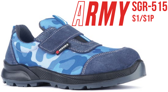
ARMY SGR-515 S1/S1P