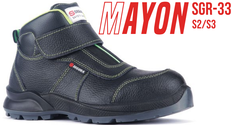
MAYON SGR-33 S2/S3