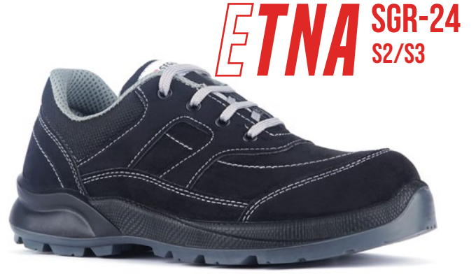
ETNA SGR-24 S2/S3