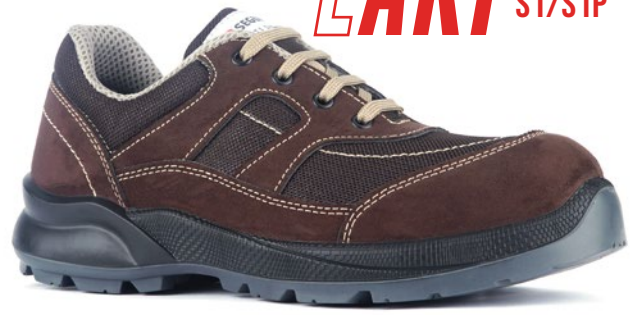
LAKI SGR-62 S1/S1P